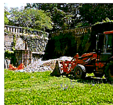
Lavori al Bastione Arena a Padova

semplice. Lo studio Valle era arrivato sesto in graduatoria. Le prime due offerte però avevano un ribasso percentuale superiore alla soglia di anomalia. Terzo e quinto arrivato non avevano invece i «requisiti speciali ri-