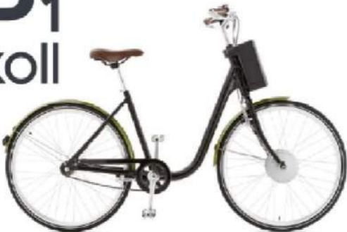
eB 1 Askoll