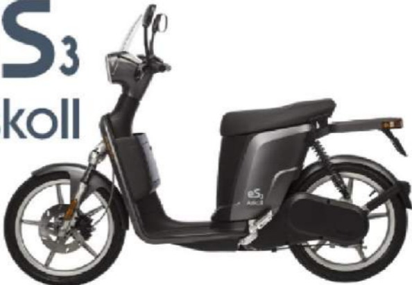
eS 3 Askoll