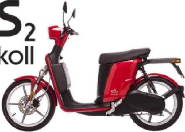
eS 2 Askoll