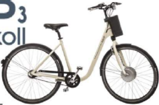
eB 3 Askoll