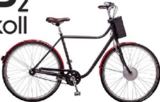
eB 2 Askoll